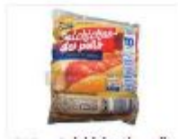
1 kg - Detergente