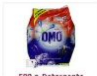
500 g - Detergente