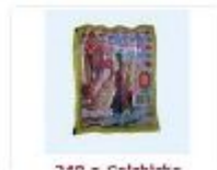
300 g - Gelatina

4- Llena los datos que le solicitan, sería su paso 1 de 6..