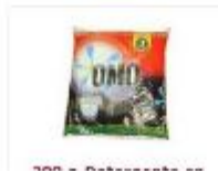
700 g - Detergente