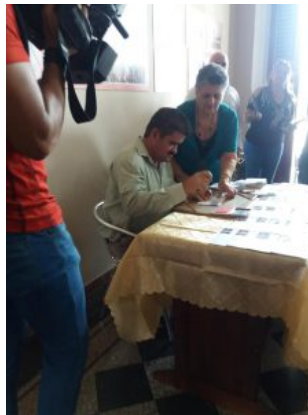
Momentos en la ceremonia de cancelación del sello postal en saludo al 150