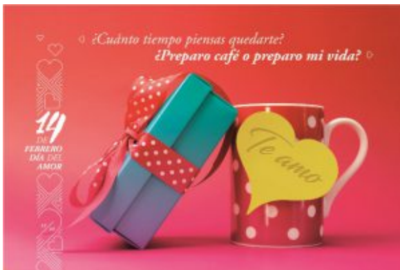
Postal 12_Jarrita y regalo