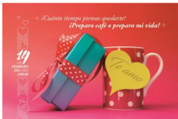
Postal 12_Jarrita y regalo

Además, las unidades de correos en todo el país mantienen a la venta al mismo precio otras postales del Día del Amor y la Amistad de ediciones anteriores, incluyendo una tarjeta troquelada con elementos dorados.