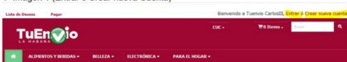
1- Imagen 1 (Entrar o Crear nueva Cuenta)

2- Luego de estar dentro de la Tienda Virtual con su usuario, debe realizar la compra que desee según su necesidad.